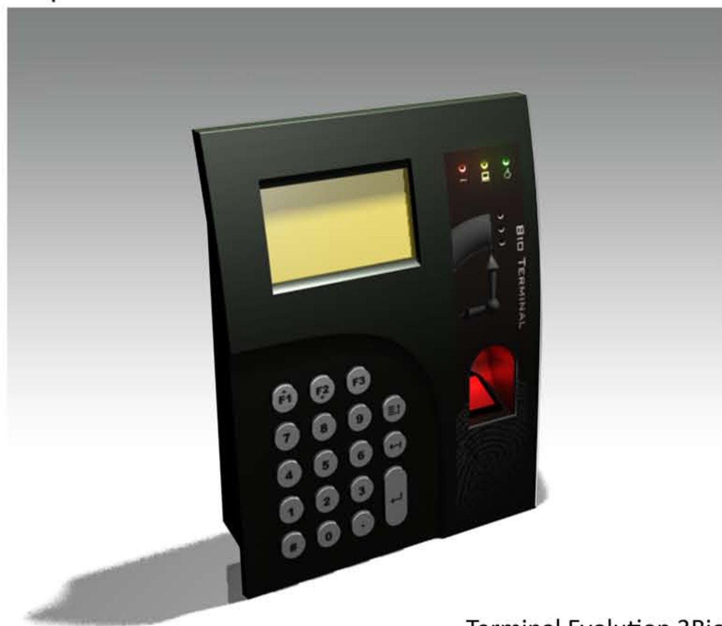
Terminal Evolution 3Bio

Utilizando a última tecnologia biométrica vencedora de prémios internacionais, a Acronym desenvolveu um terminal extremamente rápido e preciso na recolha de dados para o controlo de presença. Esta nova tecnologia evita que os funcionários de uma empresa efectuem picagens de ponto pelos colegas, para além de eliminar a habitual desculpa do esquecimento de cartão.